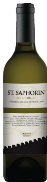
St. Saphorin Les Tourelles