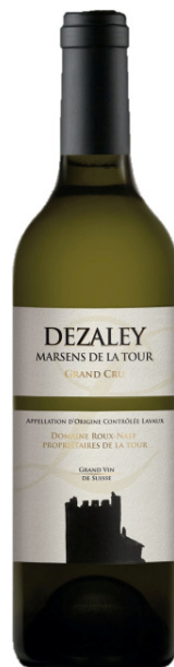
Dezaley Marsens de la Tour Grand Cru