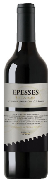
Epeesses rouge Les Tourelles