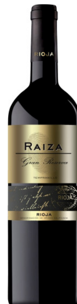
Raiza Gran Reserva